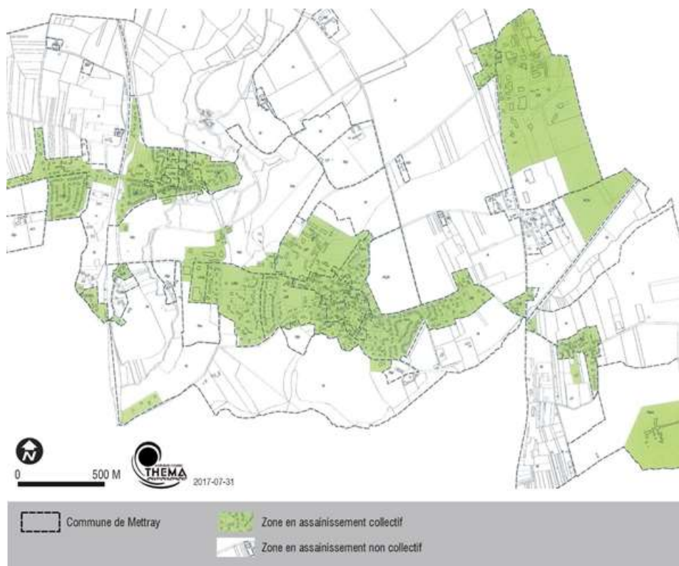
Carte : zonage d'assainissement collectif en vigueur sur la commune de Mettray

Tours Métropole Val de Loire engagera prochainement la révision du zonage d'assainissement afin d'ajuster le zonage d'assainissement collectif aux nouvelles zones à desservir.